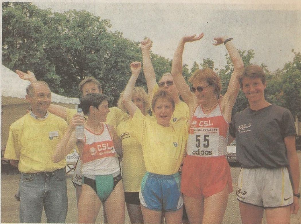
Les féminines du CSL et leurs dirigeants: heureux!

Une belle issue pour une épreuve organisée à la perfection par le CSLNB dont c'était le 3 e titre national en féminines après ceux obtenus par équipes en montagne, le dernier en 1996.